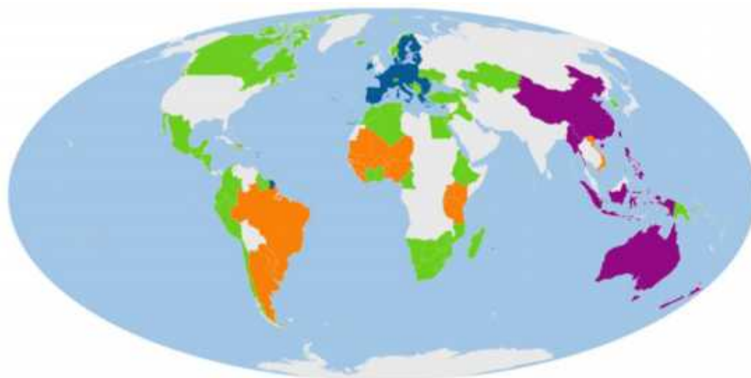
Figura 3 – Ponto de situação dos acordos comerciais estabelecidos pela UE em Maio de 2020